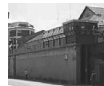
Il carcere Miogni di Varese