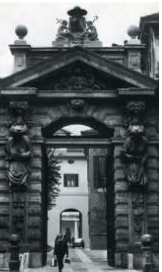
Ingresso del Seminario di Milano