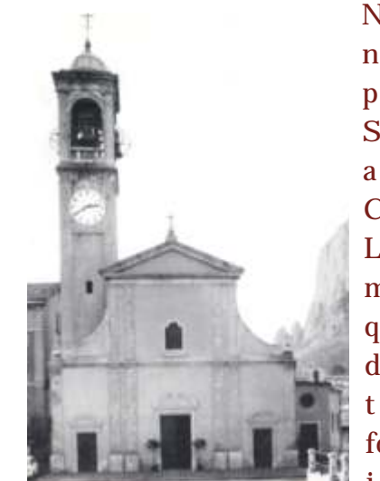
La chiesa parrocchiale di San Giovanni alla Castagna

Nel 1936 fu nominato parroco di S. Giovanni alla Castagna di Lecco: un ministero al quale si dedicò con tutte le forze e che imprime indelebilmente la sua anima con i segni della cura e della passione pastorale. Al centro della sua vita pastorale stava una profonda e