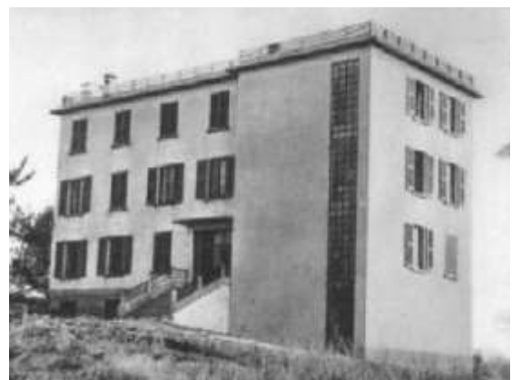
La prima casa di Vedano Olona

Nel 1937 don Luigi Monza fondò l'Istituto Secolare delle Piccole Apostole della Carità e diede corpo alla sua intuizione fondando a Vedano Olona (Va) "La Nostra Famiglia" che, nell'arco