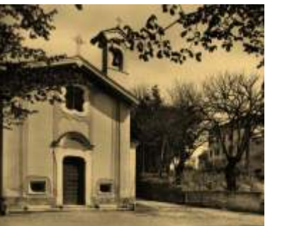
La chiesetta del Lazzaretto

Il clima si inasprì e le provocazioni dei fascisti si ripetevano, fino a simulare un falso attentato nei confronti del Vice Podestà, che venne ferito, e per il quale furono accusati i giovani cattolici e i loro sacerdoti, considerati dei sobillatori.