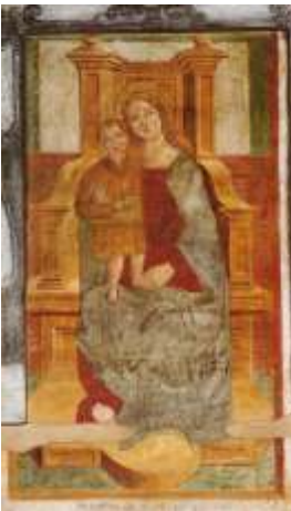
Immagine venerata nel Santuario di Varigione