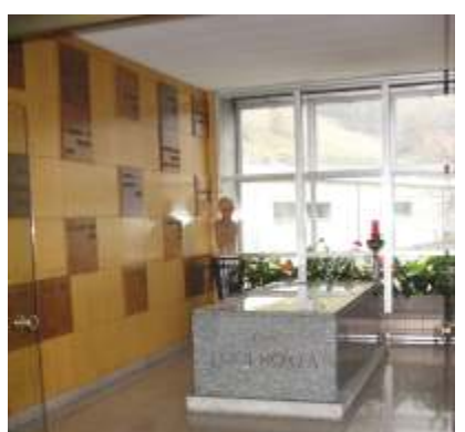
Il sacello con la tomba del Beato Luigi Monza

A Ponte Lambro, nella seconda casa del nuovo Istituto secolare delle Piccole Apostole della Carità, sono risonate, come un eco di speranza, le parole profetiche di don Luigi affidate in punto di morte a Zaira Spreafico che guidava l'Istituto: «Vedrai, vedrai, ma vedrai».