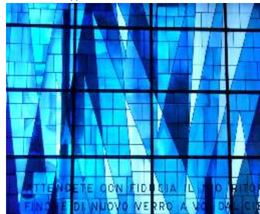
Vetrata della cappella di Ponte Lambro

I diversi ambiti di impegno sorti dalla spiritualità di don Luigi stanno a testimoniare la ricchezza del suo carisma che ha sempre saputo comunicare la luce del Vangelo, proponendosi come una possibilità di vita per tutti.