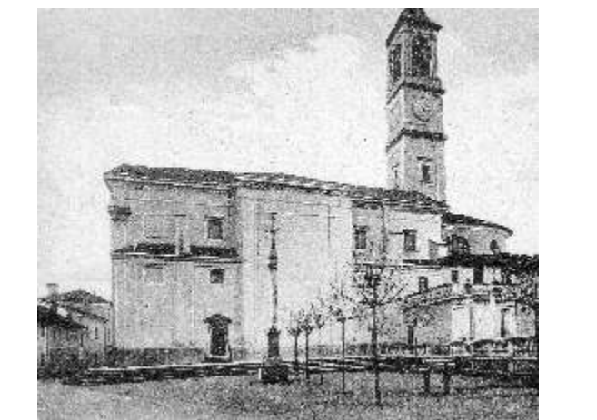
La piazza e la Chiesa Parrocchiale di Vedano Olona