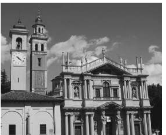
Il Santuario della Madonna dei Miracoli