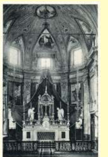
Altare della chiesa di San Giovanni alla Castagna

Perché anche i loro cuori siano illuminati dalla tua presenza.